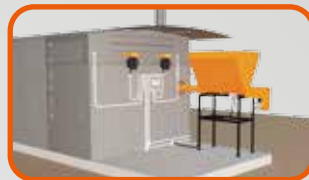
Opcionais: Sistema alimentador de palha, serragem, entre outros; Janela para carregamento superior.